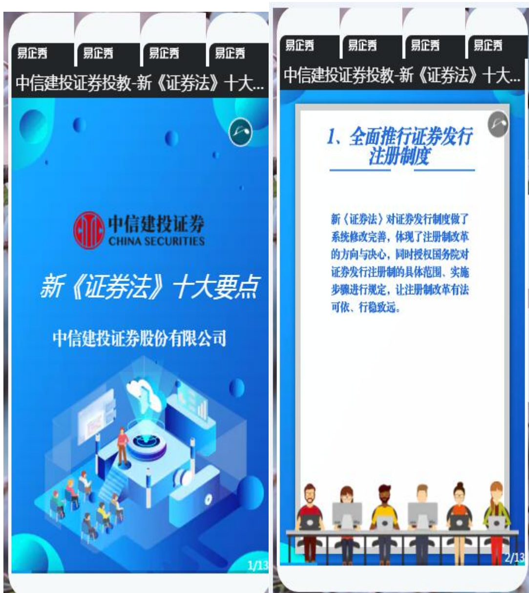
作品三：通过易企秀宣传新《证券法》十大要点